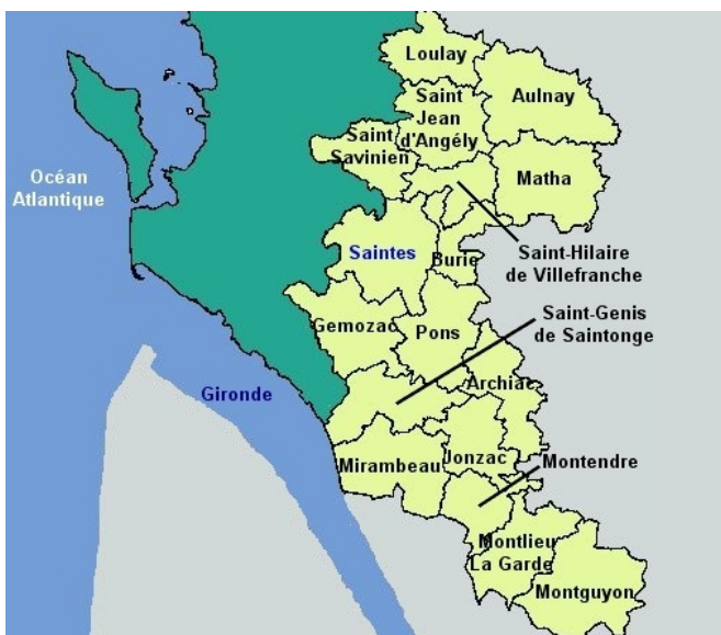
Comité "Saintes/Jonzac/Saint Jean d'Angély"